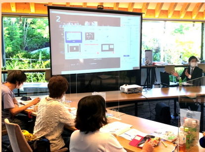
サーラプラザ佐鳴台会場

佐鳴台会場では接続の不具合が発生し、説明が駆け足になるなどご迷惑をお掛けしてしまいました。参加された方からは、「親切、丁寧に説明していただいた」「Zoomをやってみたくと思った」「セミナー参加の新しい方法を覚えることができ満足した」などの温かいお言葉をいただきました。