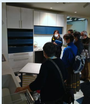
美しいデザインの商品の見学

見学会当日は、まずサーラプラザ佐鳴台にて水素自動車MIRAIの見学を実施。その後昼食をすませ、浜松市西区西山町にあるトクラス工場へ。熟練職人達による人造大理石カウンターの注型工程や、マーブルシンクの