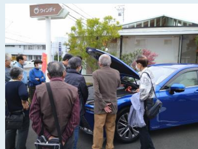
水素自動車MIRAIの見学

参加された方からは「ショールームで目の保養ができた」、「入浴体験は今後の参考にしたい」など、ご満足いただいた感想が聞かれましたので、サーラオーナーズクラブでは、またこのような見学会の企画をしていければと思っております。