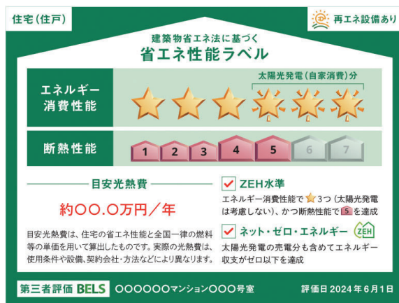
▲国土交通省「省エネ性能表示制度ガイドライン」より

これは建築物を取引する際に、図のような省エネ性能ラベルを表示する制度で、特に4月以降に建築確認申請が行なわれる新築物件については、売買・賃貸する事業者に表示の努力義務が課されることとなります。